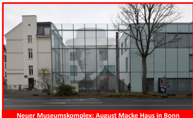
Neuer Museumskomplex: August Macke Haus in Bonn

Ein gesegnetes Weihnachtsfest und einen hoffnungsfrohen Jahreswechsel, verbunden mit herzlichen Grüßen im Auftrag des Vorstands